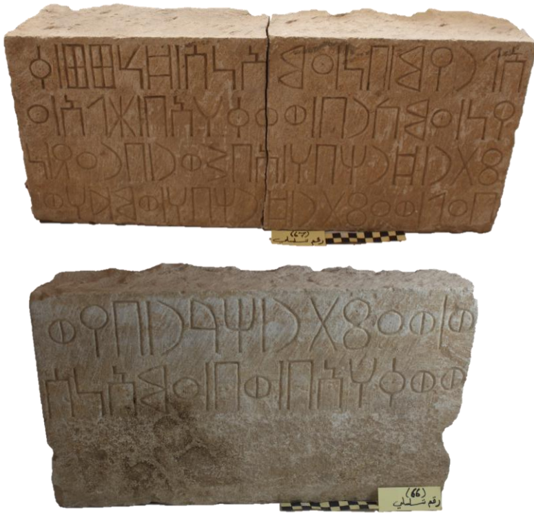
لوحة ٧: النقش (المتحف الوطني رقم تسلسلي ٦٦-٦٧ / (Kamna 29))