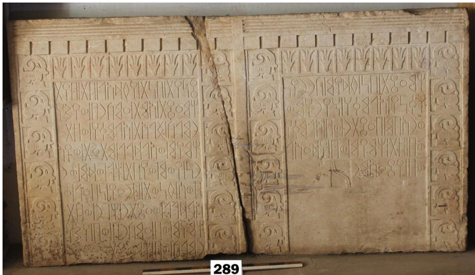
لوحة ٥-٦: النقشان (٢٨٩ م.س/Kamna 30 A, B)