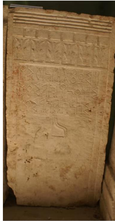
لوحة ٤: النقش (١٢٤ م.س/Na -Kamna 10)