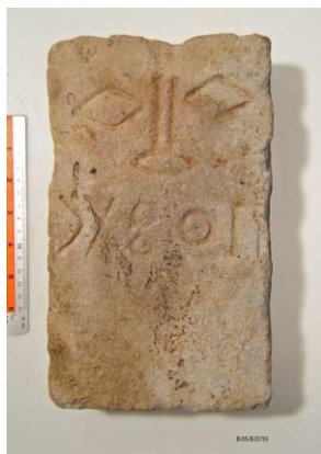
شاهد قبر نحت عليه اسم "بعثتر"